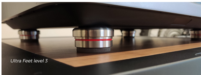
Ultra Feet level 3