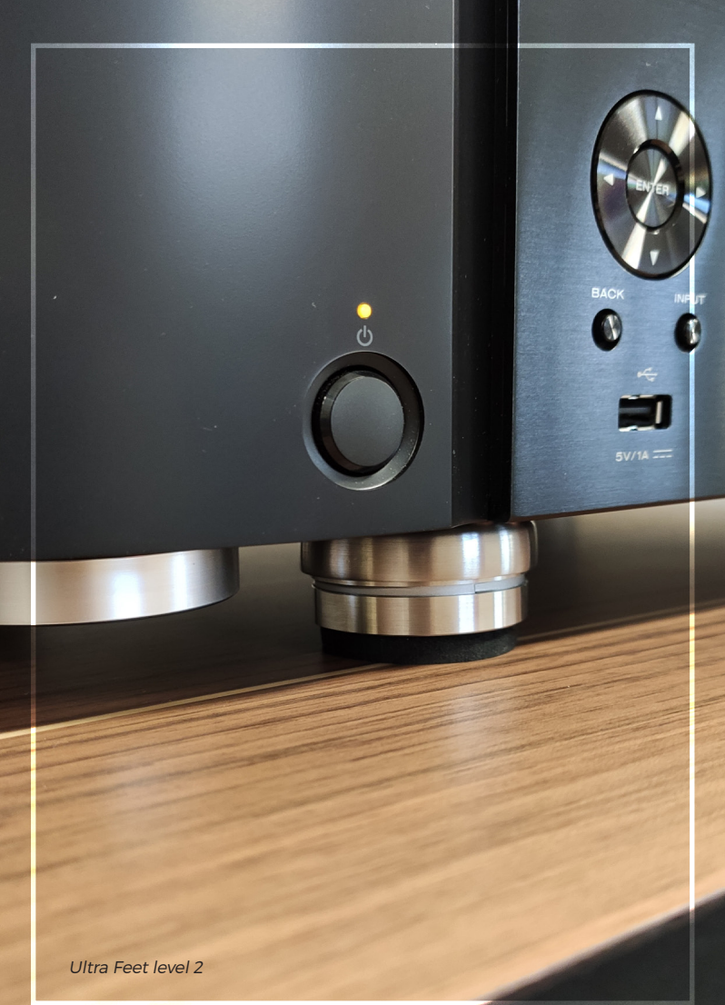
Ultra Feet level 2